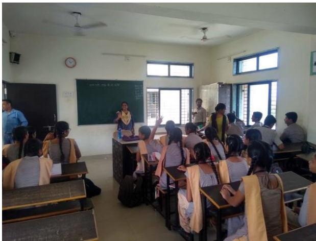
Interaction of CMLRE Researchers with the students regarding marine plastic pollution