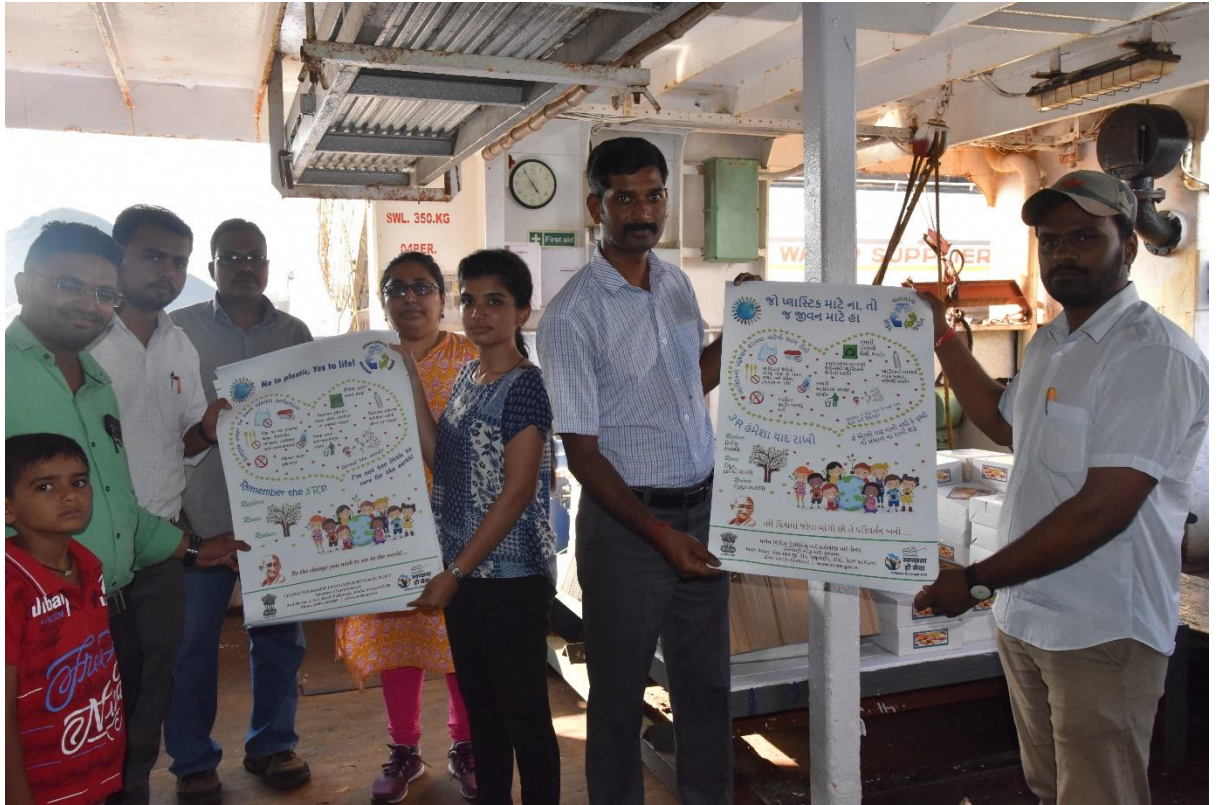
CMLRE researchers handing over multilingual posters on fighting plastic pollution to school teachers at the end of their visit to FORV Sagar Sampada.