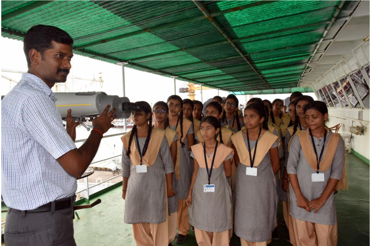
Dr. K Chandrasekar explaining about marine mammal observation using big eyes and creating awareness about negative impacts of plastics on marine mammals