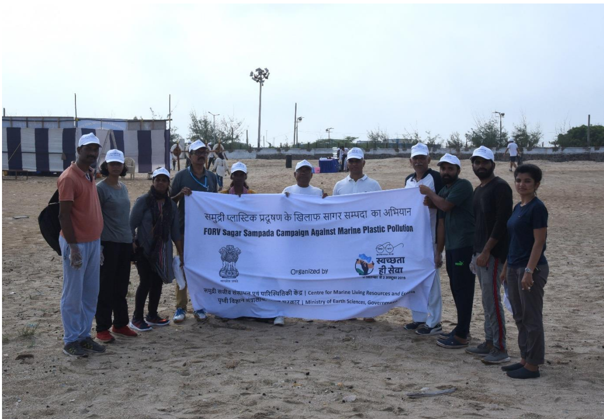
CMLRE, MoES researchers and FORV Sagar Sampada cruise team participating in beach clean-up at Okha organised by Indian Coast Guard on 21 st September 2019 as part of Swatchta hi seva and coastal clean-up day.