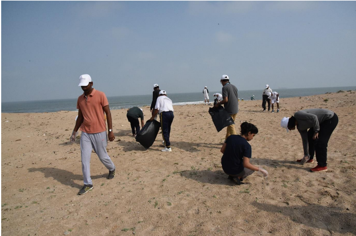
CMLRE researchers participating in beach cleaning activity along with Indian Coast Guard at Okha.